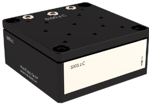
S100.z.C / S